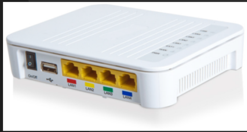
Fiber till LAN konverterare (CPE) Inteno XG6846