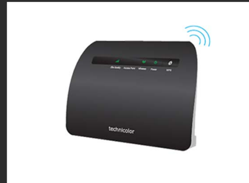
WiFi-Brygga och Trådlös Digitalbox anslutning Technicolor TG234 (Tillval 499 kr)